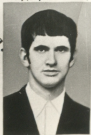
КИНАШ НИ. прож. Донецкая обл. г. Горловка ул. Карамзина 48 под следств.